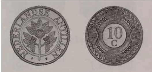
10 cent 1989 – 2003 Nederlandse Antillen