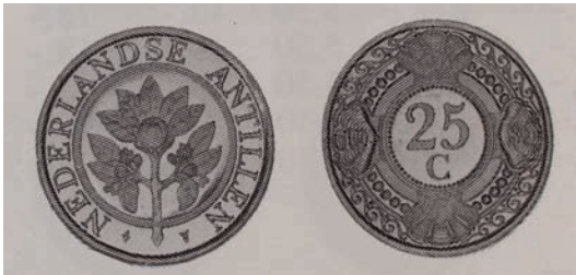
25 cent 1989 – 2003 Nederlandse Antillen