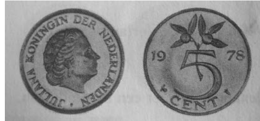
5 cent 1978 Nederland