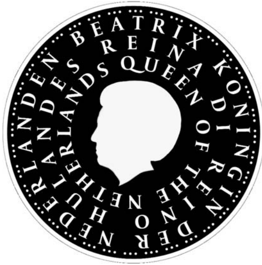
Glanzende gedeelten munt