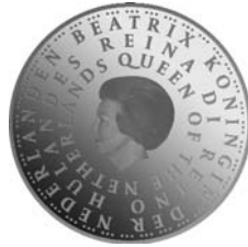
Zilveren vijf-euromunt (diameter : 29 mm)