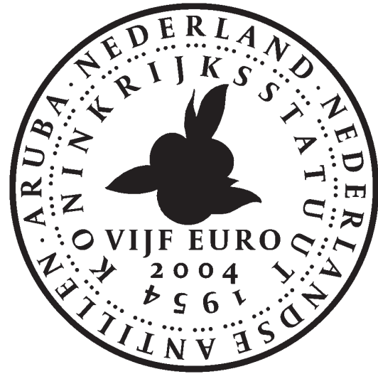
Matte gedeelten munt