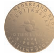
Gouden tien-euromunt (diameter : 22,5 mm)