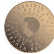
Gouden tien-euromunt (diameter : 22,5 mm)