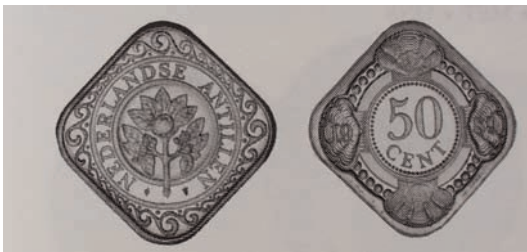
10 cent 1989 – 2003 Nederlandse Antillen