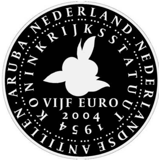
Glanzende gedeelten munt