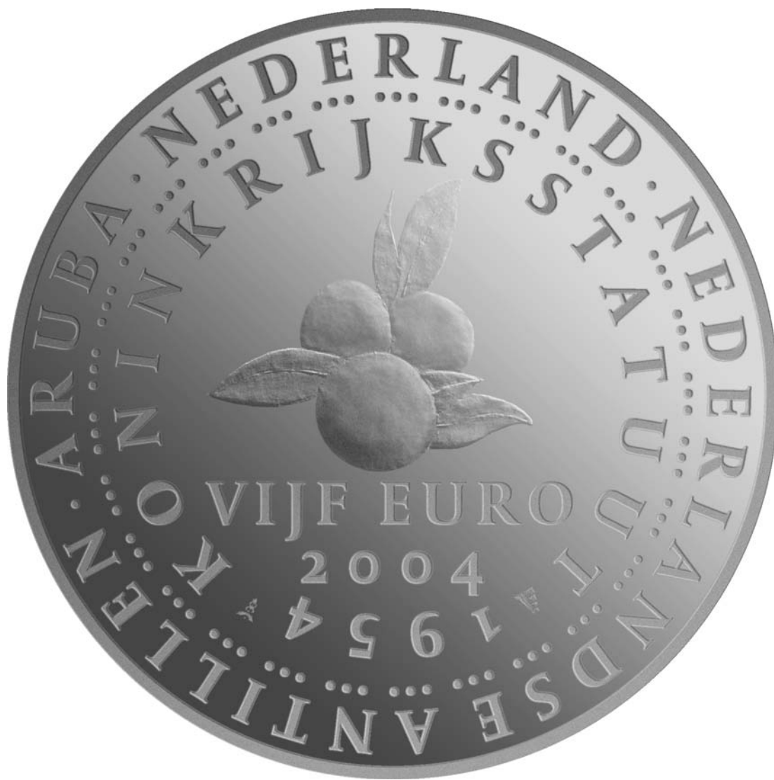
Ontwerp zilveren vijf-euromunt ter gelegenheid van 50 jaar Statuut van het Koninkrijk der Nederlanden