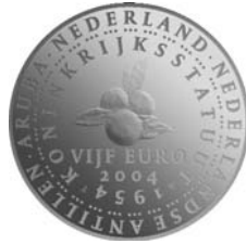
Zilveren vijf-euromunt (diameter : 29 mm)